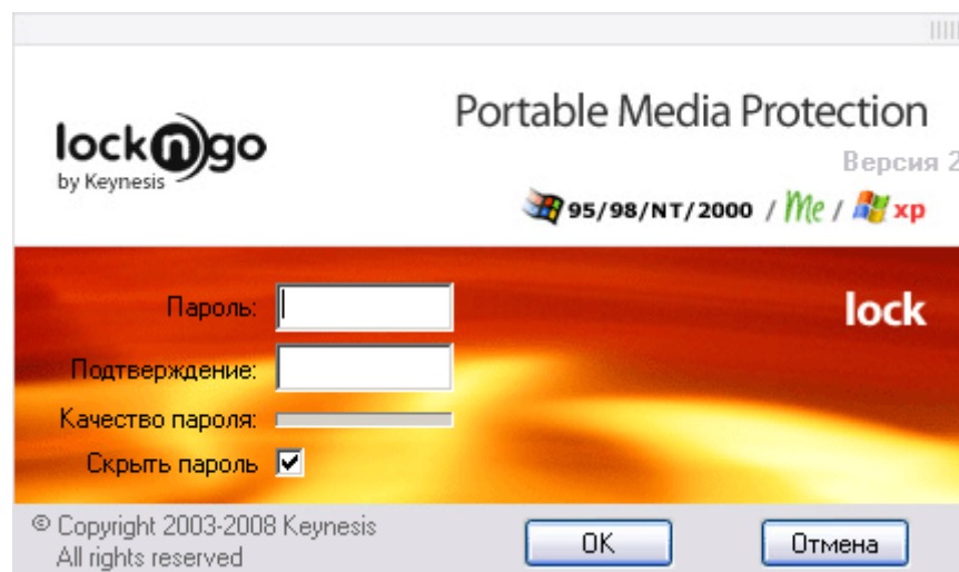
Рисунок 1: Интерфейс пользователя Lockngo

Рекомендация: Мы рекомендуем использовать пароль, содержащий не менее 8 символов включающий прописные и заглавные буквы, цифры и специальные символы, такие как: ~!@#%&^*.