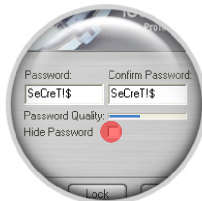
Рисунок 4: Скрыть / показать пароль