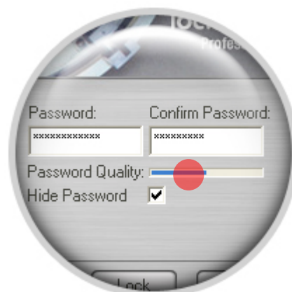
Рисунок 3: Качество пароля