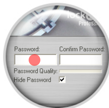
Рисунок 2: Ввод пароля

"Скрыть пароль" - снятие выделения отображает вводимый пароль