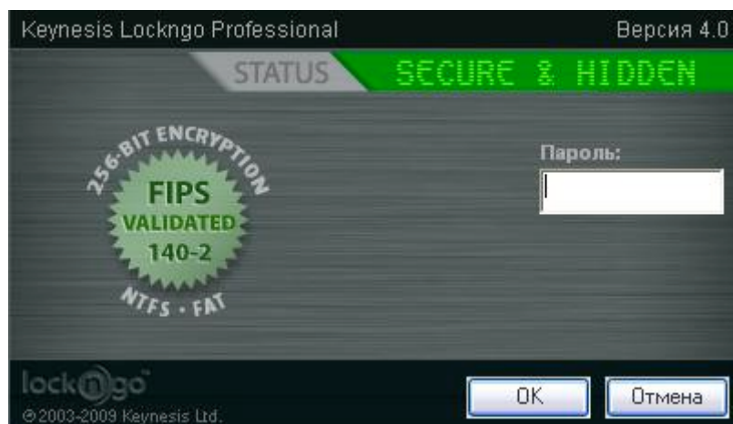
Рисунок 7: Экран разблокировки

Подключите заблокированный диск к компьютеру и запустите с него Lockngo.exe. Введите пароль, который был использован для его блокировки и нажмите 'OK'.